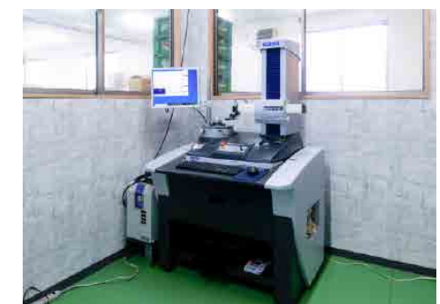
真円度測定器 東京精密