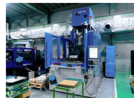
縦型回転式仕様成形機 JSW