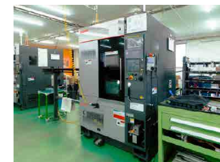
NC旋盤機械 XT-6 高松機械工業